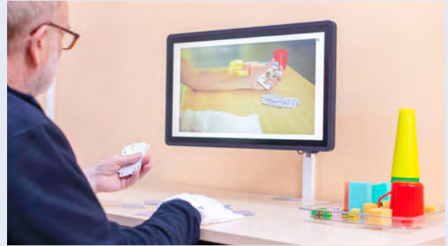
z.B. mit Spielkarten