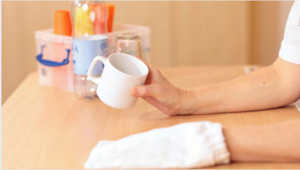
z. B. mit Tassen